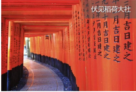
伏见稻荷大社 二月吉日建之 三月吉日建之 四月吉日建之 五月吉日建之 六月吉日建之 七月吉日建之 八月吉日建之 九月吉日建之 十月吉日建之 十一月吉日建之 十二月吉日建之