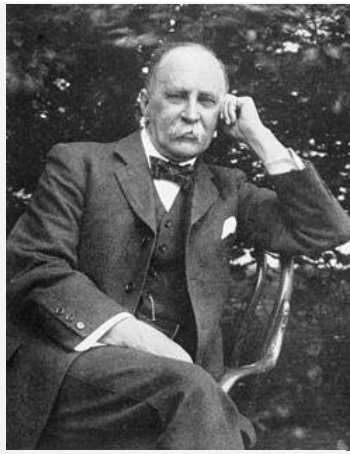
约翰·霍普金斯大学医学院创 始人之一 威廉 奥斯勒