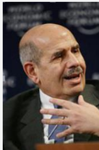
现代芝加哥经济学派创始人 雅各布 瓦伊纳