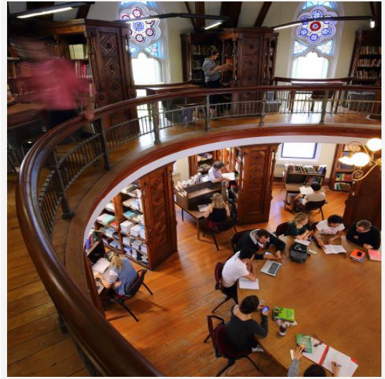
Humanities and Social Sciences Library

麦吉尔大学有 12 个图书馆，超过五百万本书籍和杂志，二百三十万种电子书籍和杂志，上千种影音音像资料和各种地图，微缩印刷品。图书馆还提供校际图书馆借阅服务，古籍资料查询服务等各种图书馆学习相关服务。其中位于 Downtown Campus 的人文社科图书馆，即 McLennan-Redpath Library ( McLennan Library ) 为社科类学生广泛使用。本项目工科专业的学生也可使用 Schulich Library of Science and Engineering。