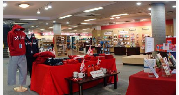
McGill University Bookstore