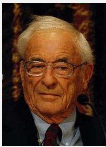
2009 年诺贝尔物理学奖获得者 威拉德·博伊尔