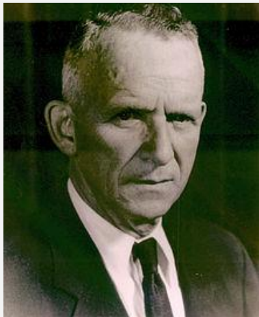
联合国秘书处人权司首任司长， 《世界人权宣言》起草人之一 约翰·汉弗雷