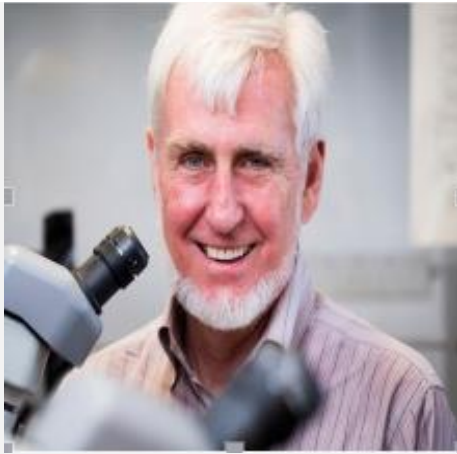
2014 年诺贝尔生理学或医学奖获得者 约翰·欧基夫