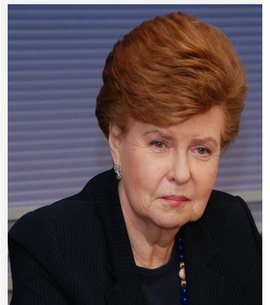
拉脱维亚第一任女总统 瓦伊拉·维凯 - 弗赖贝加