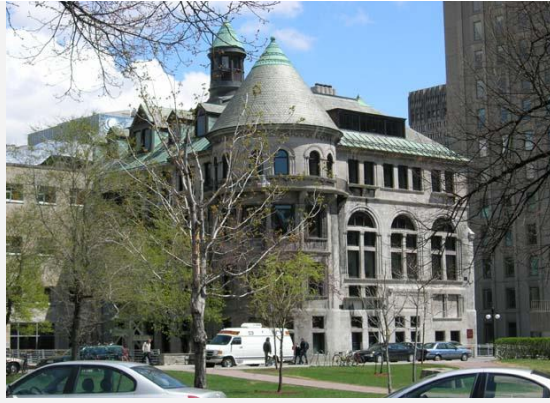
Schulich Library of Science and Engineering