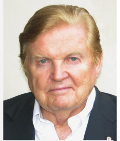
1999 年诺贝尔经济学奖获得 者 “欧元之父” 罗伯特·蒙代尔