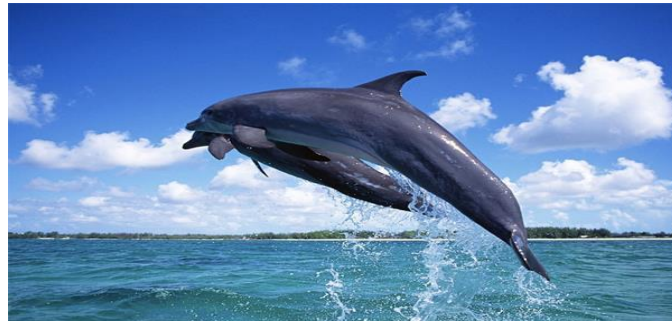
史蒂芬港尼尔森湾