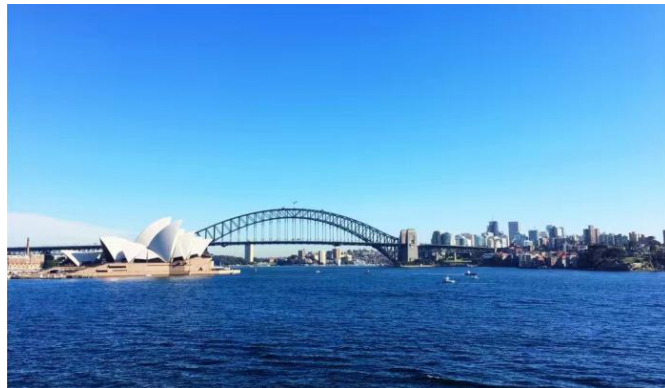
悉尼歌剧院和悉尼大桥