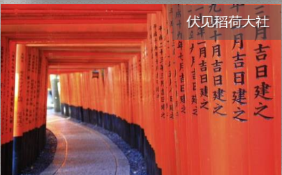
三月吉日建之 二月十日建之 九月十日建之 伏见稻荷大社 一月吉日建之